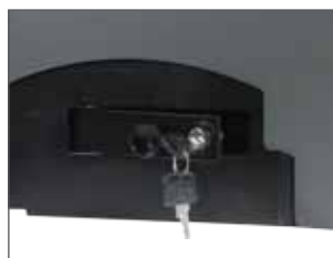
Sblocco manuale con chiave DIN