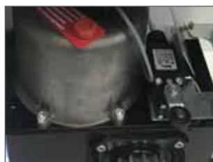
Lubrificazione in bagno d'olio