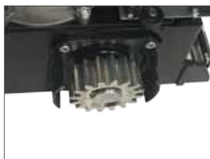
Pignone Z16 modulo 4