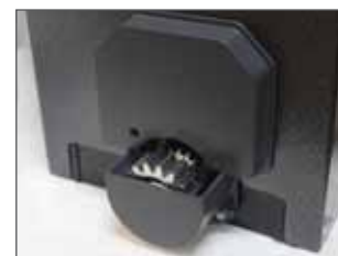
Encoder Assoluto POSITON GATE RT