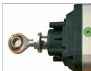
Snodo sferico per regolazione millimetrica della corsa