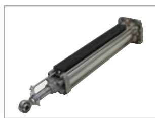
POSITION GATE Encoder assoluto lineare (opzionale)