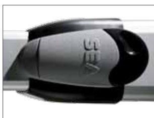
Sistema di sblocco metallico PLUS con serratura (optional su versione HALF TANK 270)