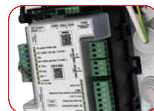
Centrale elettronica UNIGATE