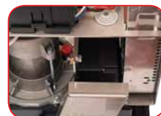
Encoder Assoluto POSITION GATE RT