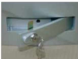
Sblocco con serratura in metallo di serie