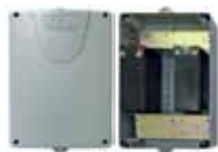
Batteria con scatola 7AH