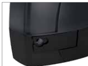
Trattamento speciale in cataforesi (versione 400-600 ed 800)